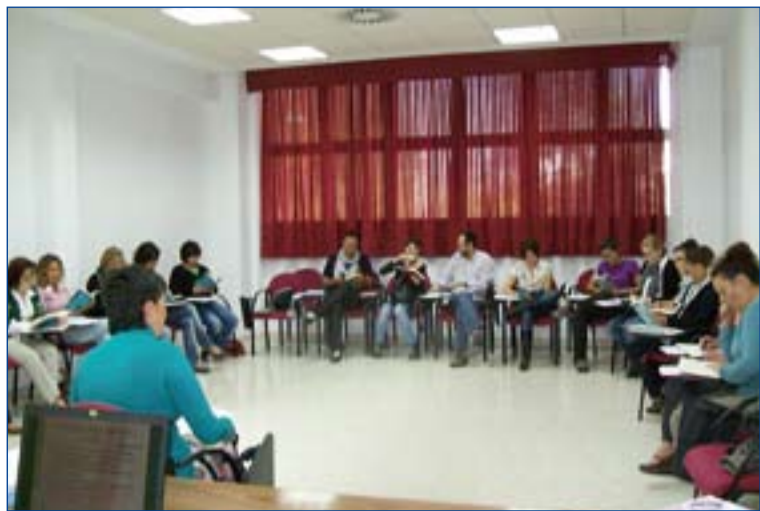
Encuentro de formación para trabajadores de Cáritas.

Por este motivo se pusieron en marcha una serie de programas para atender a esta población. Entre estos programas encontramos "Vivo en mi barrio", que comenzó su andadura en el 2009, de prevención selectiva en las barriadas pacenses de Los Colorines, Gurugú y la Luneta. Con él se ha llegado a 210 familias, 18 profesores, 216 alumnos y 13 agentes sociales.