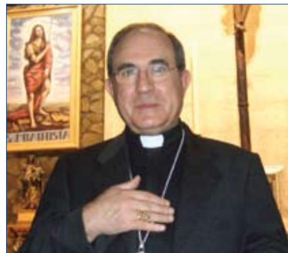
Monseñor Asenjo, Arzobispo de Sevilla.

El congreso, financiado por instituciones públicas de la capital y la región de Sevilla,