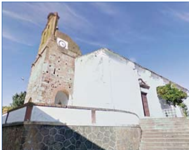
Templo parroquial de Valle de Santa Ana.

Al interior la planta rectangular está compuesta de tres naves con cuatro tramos cada una. La nave central es la zona más antigua, presenta arcos graníticos apuntados apoyando sobre pilares recocidos, de estilo gótico. Las cubiertas son de bóvedas vaídas en los dos últimos y de elemental crucería en el anejo a la cabecera. En el de los pies se aloja un coro con balaustrada de madera. Los arcos formeros, que comunican con las naves laterales, son de estilo barroco. La cabecera presenta estructura triple compuesta por tres capillas de planta cuadrangular, la mayor con cúpula sobre pechinas, y las laterales de nervaduras de tosca crucería. El primer tramo está ocupado en la nave central por el coro y en las dos laterales por capillas, las naves están separadas entre sí por arcos de medio punto pero la nave central los tiene apuntados. Las bóvedas son todas de rincón de claustro, salvo la de dos tramos de la cabecera de las naves laterales y la del tramo previo al crucero en la nave central, que son de aristas. El crucero se cubre con cúpula semiesférica sin linterna. En la cabecera tiene la iglesia adosado un edificio que alberga la sacristía y la casa parroquial. A los pies, en el exterior, como prolongación de la nave cen-