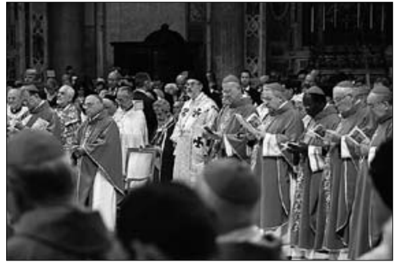
En el Sínodo están participando Obispos de las distintas iglesias orientales en comunión con Roma.

"Pero es también la región en la que el cristianismo nació