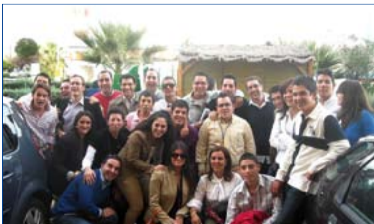
Participantes en el encuentro.

A continuación, se celebró la Eucaristía, presidida por Manuel Ruiz, tras la cual se realizó una visita guiada por las diferentes capillas de Campanario, donde la hermandad tenía expuestos sus imágenes y enseres. La visita concluyó en la ermita de Ntra. Sra. de Piedraescrita, patrona de la localidad, con una ofrenda floral.