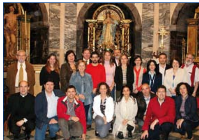
Los miembros del EIPAF.

La idea es la de potenciar la Pastoral Familiar en las parroquias a través de la intervención de un equipo de matrimonios (el EIPAF), generalmente formado por agentes de pastoral familiar y parejas procedentes de diversos movimientos y carismas. Mediante una serie de charlas centradas en la presentación del Directorio de la Pastoral Familiar de la Iglesia en España (CEE, 2003) los E.I.P.A.F.