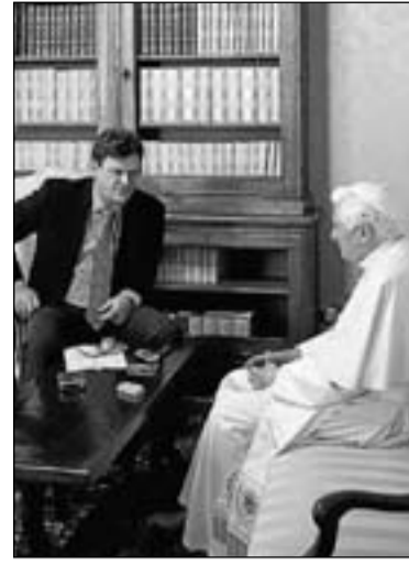
Benedicto XVI no ha dejado ninguna pregunta sin contestar en el libro de Peter Seewald, editado en España por Herder.

El volumen que se presenta hoy, dijo, “es una entrevista que, en cierto sentido supone un reto para hacer un serio examen de conciencia dentro y fuera de la Iglesia con el fin de lograr una verdadera conversión del corazón y de la mente. Las condiciones de vida de la sociedad, la ecología, la sexualidad, la economía y las finanzas, la misma Iglesia... son cuestiones que requieren un esfuerzo especial para verificar la dirección cultural del mundo de hoy y las perspectivas que se abren para el futuro. Benedicto XVI no se deja intimidar por las ci-