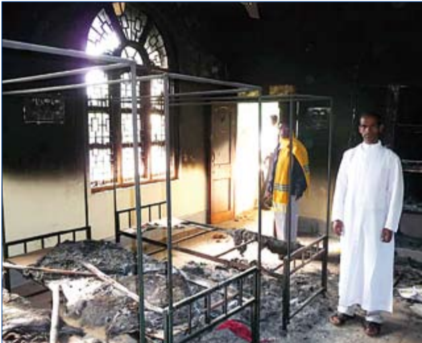
Centro Pastoral de Konjamendi, en Orissa (India), que sufrió el ataque de extremistas hindúes.

Presentado el nuevo Informe sobre Libertad Religiosa de la asociación católica "Ayuda a la Iglesia Necesitada"