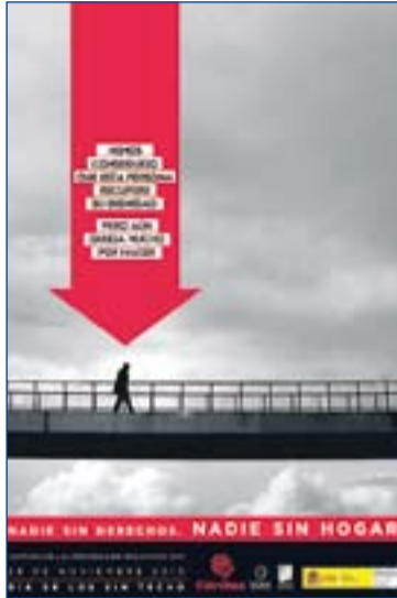
Cartel de la campaña 2010.

En cuanto a nuestra Diócesis, Cáritas cuenta con dos centros: el Centro Padre Cris-