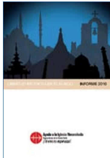
Portada del Informe.

Desde el anterior informe, la situación no ha mejorado, según esta organización que presta ayuda a cristianos de todo el mundo. Según informa AIN la tendencia creciente a la persecución y discri-