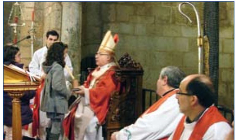
El Arzobispo presidió la celebración.

cristiana emeritense, que se recuperó el año pasado, y que fundamentó los juegos florales de la Edad Media y siglos posteriores.