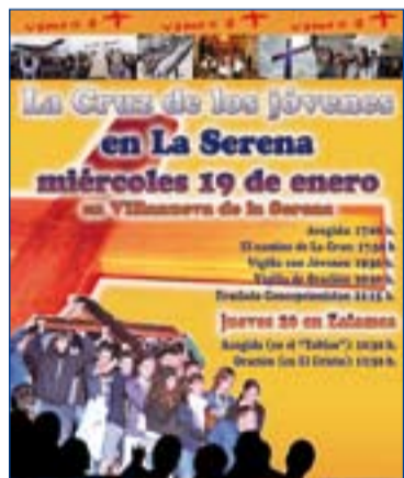
Cartel para animar la participación en los actos.

Por estas fechas muchos animadores y jóvenes en nuestra Archidiócesis están preparando los actos, especialmente para jóvenes, adolescentes y adultos, que tendrán lugar esos días