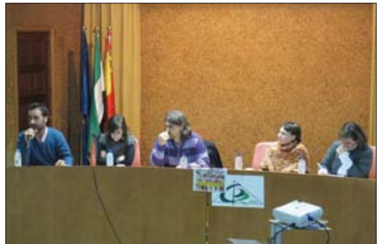
Un momento de la mesa redonda.

apuesta por gestos humanizadores para hacer una sociedad más justa y fraterna,