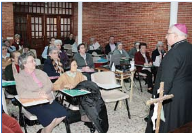
El Arzobispo se dirige a los participantes.

A continuación, se hizo el balance anual de CONFER, se aprobaron las cuentas del