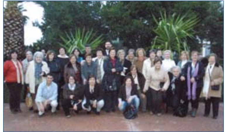
Retiro de la parroquia de San Fernando y Santa Isabel.