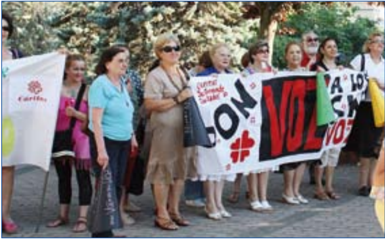
Actividades de una caritas parroquial.

Fraternidad como una propuesta de vida que pone en relación a unos con otros e invita a salir de nuestro universo particular, para interesarnos y corresponsabilizarnos de la vida de los demás y de lo que ocurre en nuestro mundo, bajo el lema "Sin ti, no somos nosotros. Somos vecinos, hermanos. Si tú no estás, nos falta algo".