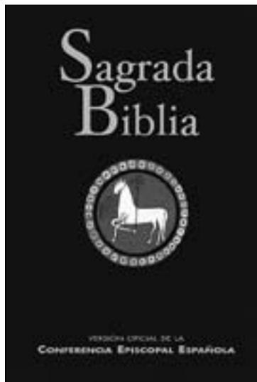
Portada de la edición de la CEE.

No es la primera vez que la CEE encarga traducciones de la Biblia que asume como propias. De hecho, esta traducción tiene antecedentes