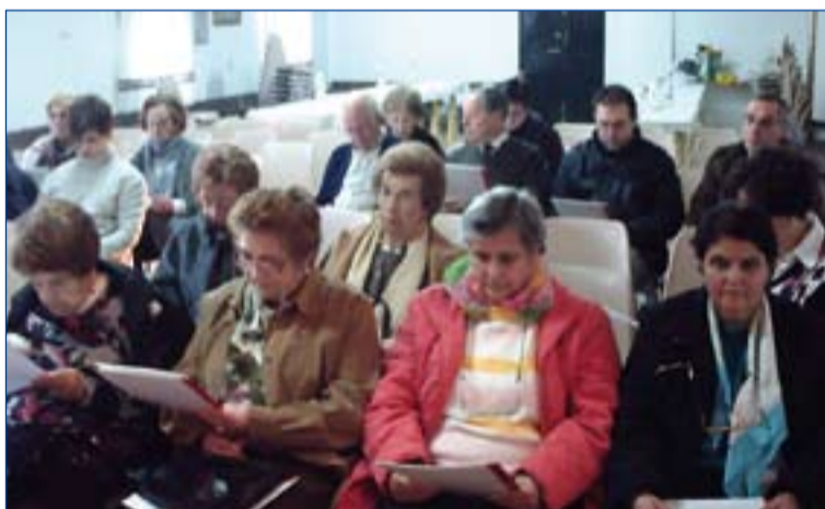
Encuentro celebrado en Llerena.

Por otro lado, 31 voluntarios de Cáritas arciprestal