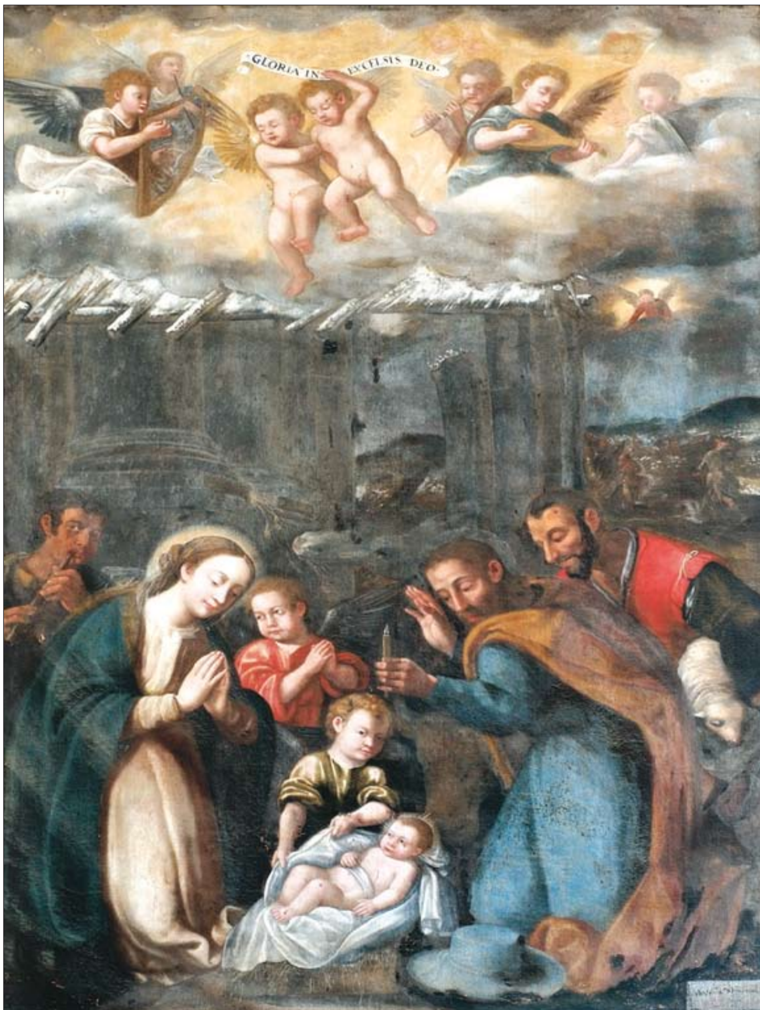
Cuadro del Nacimiento, de Antonio Monreal, 1633, que se encuentra en el Museo de la Catedral de Badajoz

AÑO XVIII • Nº 877 • SEMANARIO DE LA ARCHIDIÓCESIS DE MÉRIDA-BADAJOZ • 25 DE DICIEMBRE DE 2011